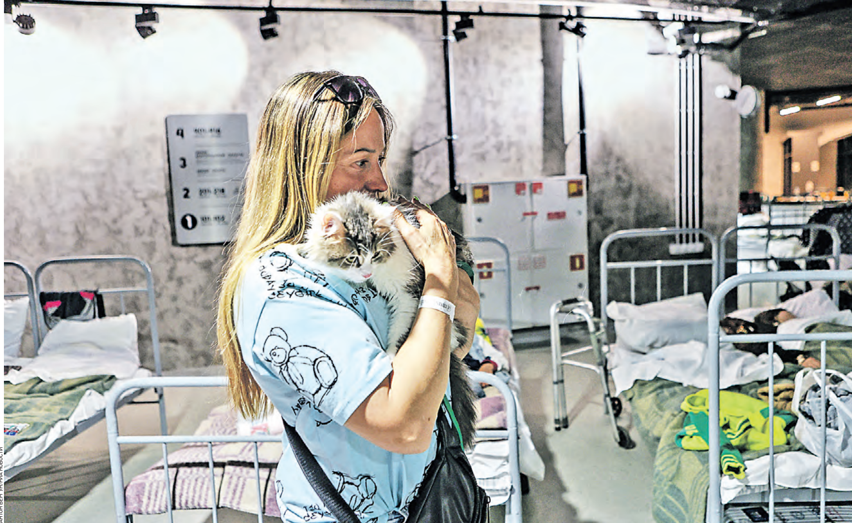
1 июня 2023 года. Жительница Белгородской области и ее питомец в пункте временного размещения, который организован на территории местного стадиона. Из-за обстрелов со стороны украинских боевиков мирное население нескольких приграничных районов эвакуируют в безопасную местность

Есть жертвы среди мирного населения. — В Новой Таволжанке и в Безлюдовке в результате обстрела погибли две женщины. От полученных травм они скончались на месте, — сообщил Вячеслав Гладков. Всего, по его словам, Вооруженные силы Украины выпустили по территории городского округа 519 единиц различных боеприпасов. — Село Муром подвергалось обстрелу 52 раза — удары наносили из ствольной артиллерии и миномета, — привел в пример глава Белгородской области. — Имеются значительные повреждения в административном здании, школе, детском саду, ФАПе (фельдшерско-акушерский пункт. — «ВМ»), поврежден один автомобиль. Кроме того, по словам Гладкова, от прямого попадания снарядов вспыхнули три пожара: в районе рынка в центре Шебекино, в частном секторе и в районе зернохранилища. Чтобы обеспечить безопасность мирных граждан, их направили в пункты временного размещения. В одном из них находятся более четырех тысяч человек. — Вся необходимая помощь оказывается. Я очень бла-