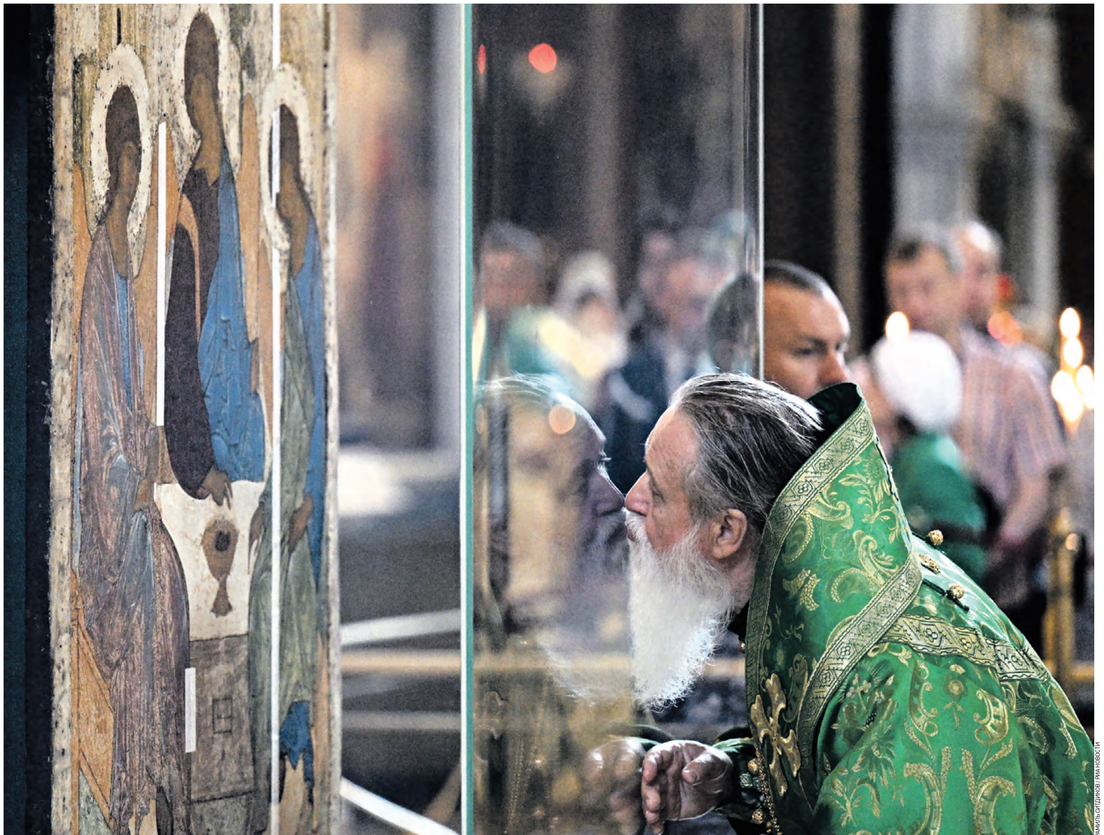
Вчера 09:10 Священнослужитель целует икону «Троица», выставленную вчера для поклонения в храме Христа Спасителя. Образ, созданный великим иконописцем Андреем Рублевым в XV веке, ныне указом президента РФ Владимира Путина передан Русской православной церкви

Ценность произведения искусства нельзя рассматривать в отрыве от его эпохи. Как часто бывает в истории человечества, что выдающиеся шедевры, воплощающие идеи гуманизма, рождаются в очень темные и беспокойные времена. Конец XIV — первая четверть XV века, когда была написана «Троица», были непростыми для Древней Руси. После победы в Куликовской битве Москва переживает разорение, устроенное ханом Тохтамышем, а через некоторое время, при занявшем княжеский престол Василии Дмитриевиче, наследнике Дмитрия Донского, окрестности столярного града разоряет и жожет хан Едигей. Василий пытается сохранить хрупкий баланс сил между Ордой и мощным Литовским княжеством, где живет много русских. Между удельными князьями нет согласия, и современники становятся свидетелями многих предательств и клятвопреступлений между владетельными родственниками-ририковичами. В это время, как писал историк Василий Ключевский, активные пассионарные люди, разочаровавшиеся в мирской жизни, стремятся в церковь, где видят остров стабильности, свободный от